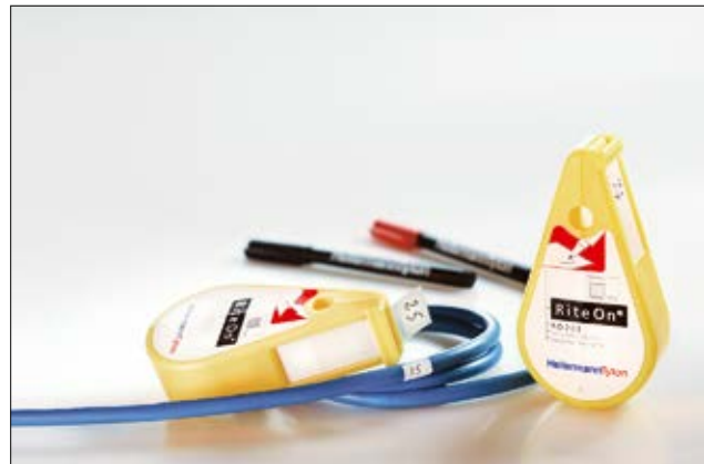
Etichette facili da scrivere e applicare con il dispenser RiteOn.