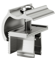
KMTU2950 Universale terminale