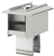
KMTU2950 Universale terminale